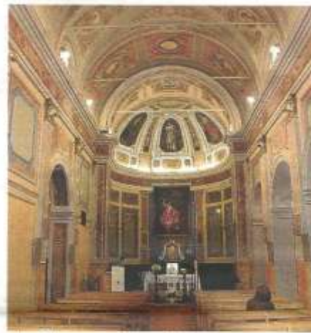
L'accoglienza notturna Caritas a S. Maria del Fiore e l'interno della chiesa dei Cappuccinini restaurate con il contributo dell'8x1000

tuale delle firme a favore della Chiesa Cattolica è stata a livello nazionale del 80,9%. A livello diocesano, per i redditi del 2008 (ultimo dato disponibile) la