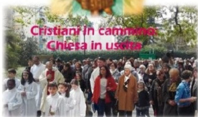
Cristiani in cammino Chiesa in uscita