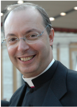
Mons. Marco Frisina

Il corso intende proporre un'esperienza ai cori ed ai coristi della Romagna con il compositore di musica sacra noto in tutto il mondo.